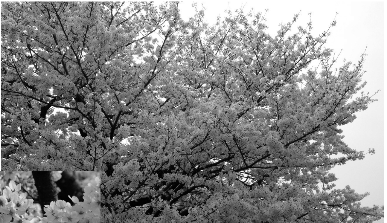
春うらら 満開の桜（3月30日撮影／取石公園）