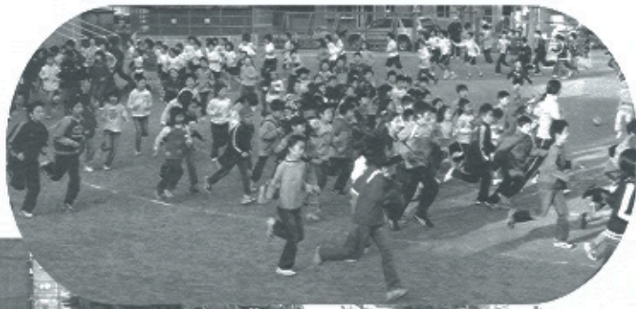
(加茂小学校 マラソン朝礼)