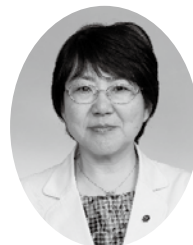
山敷 恵 議 員