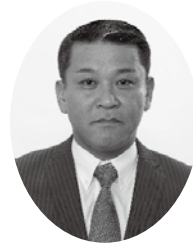
永山 誠 議 員