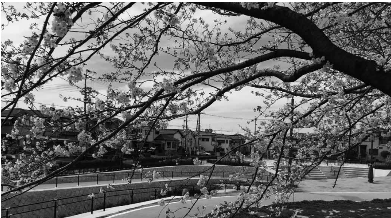
春日和のなか美しく咲く桜

なお、3月7日には、議員提案により、議案第19号「キャッシュレス社会の実現を求める意見書」など3件を提出し、いずれも可決しました。これらの結果については、2ページの議決結果一覧表をご覧ください。また、可決された意見書については4ページをご覧ください。