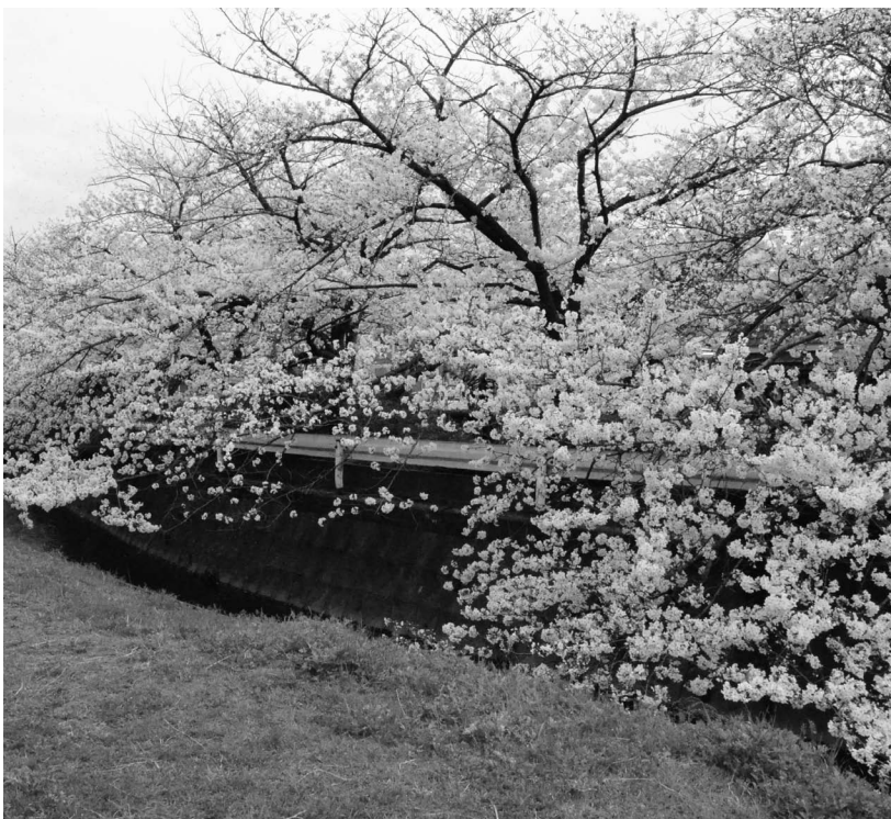
満開の桜が鮮やかな芦田川周辺 (撮影：4月1日)