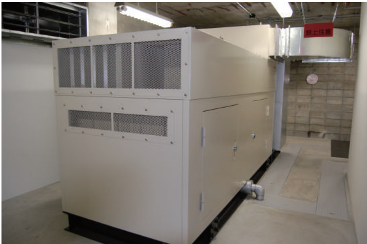
■市立中央病院の非常用発電機＝林田町