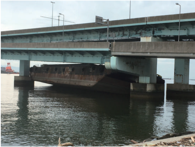
■阪神高速湾岸線の側道に衝突した台船＝9月9日、甲子園浜